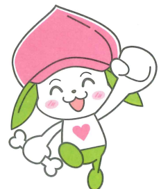
協会けんぽ福島支部マスコットキャラクター ケンタくん